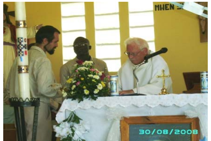
Le moment de signer dans le registre de la S.M