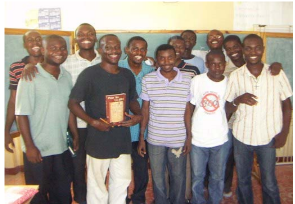
Photo des participants avec les animateurs dans la salle de cours.

Comme prévu le camp vocationnel a eu lieu du 3 au 12 août au prénoviciat. C'était une réussite totale en ce qui concerne l'organisation ; ce camp a permis aux formateurs de choisir avec l'aide de l'Esprit Saint 5 futurs prénovices qui doivent commencer leur prénoviciat à la fin du mois de septembre.