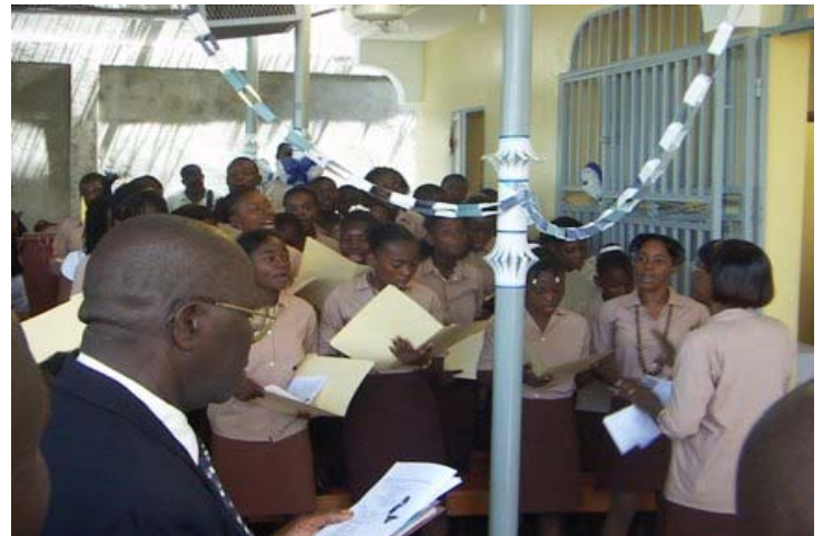
La chorale Sainte Thérèse