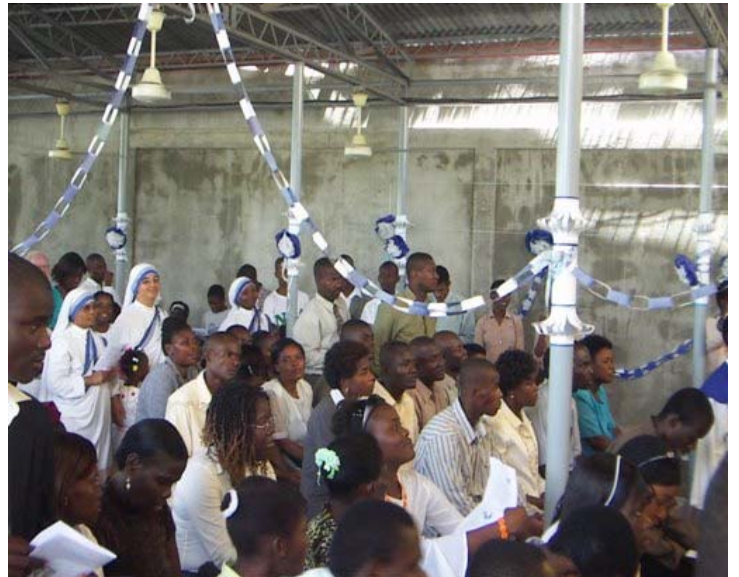
Vue des participants