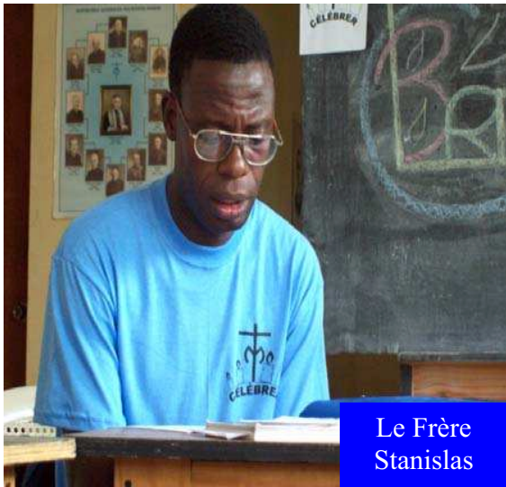
Le Frère Stanislas