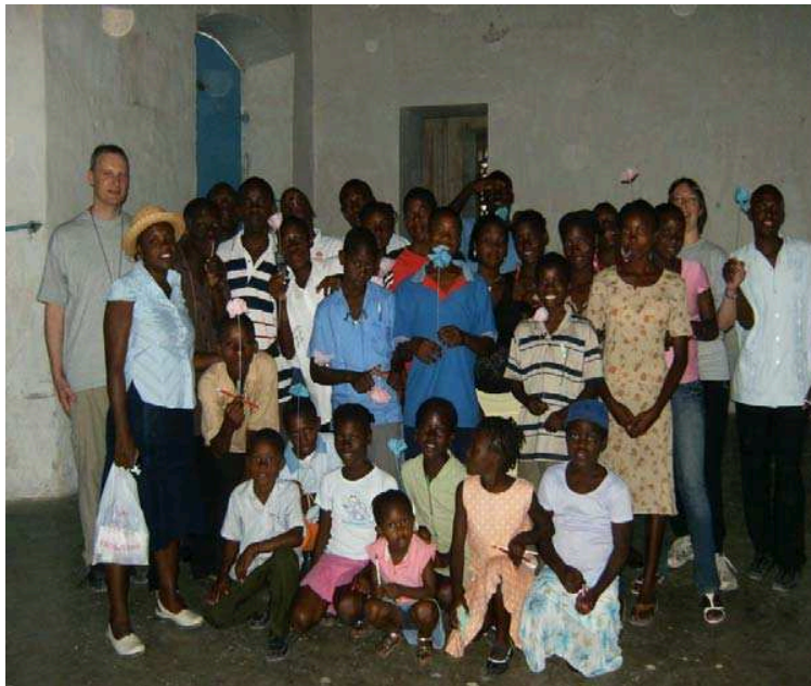
Le groupe Faustino à Hinche