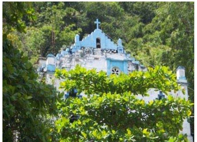
Un très beau sanctuaire marial à Grand Bassin