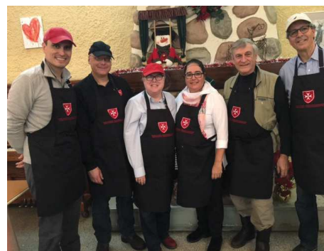
L'ORDRE DE MALTE À LAUBERIVIÈRE 04 décembre 2016