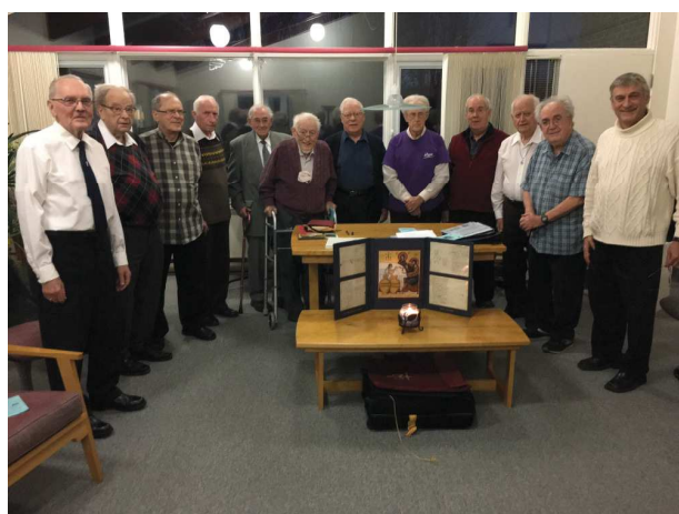
L'ICÔNE DU BICENTENAIRE À ST-ANSELME NOËL 2016