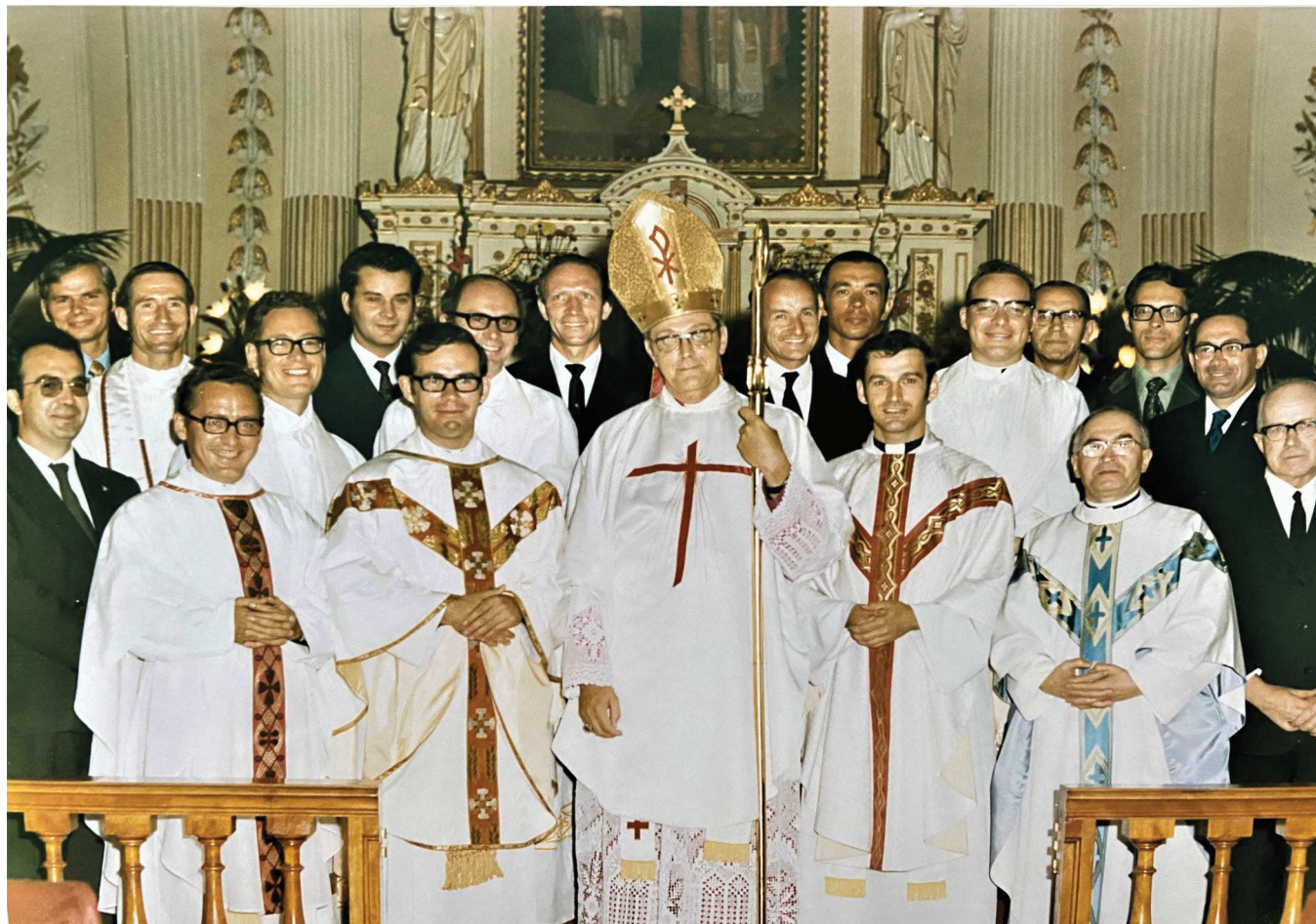
Photo prise dans l'église de Saint-Anselme le 24 juillet 1971