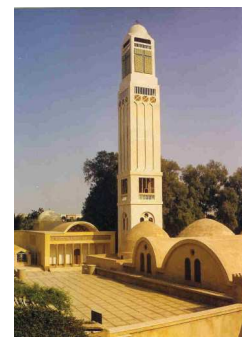
Monastère St-Macaire Restauré en 1969