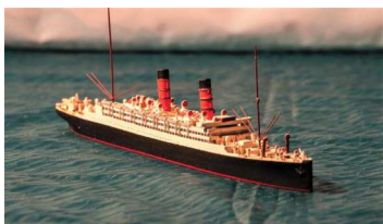
Le paquebot Carmania