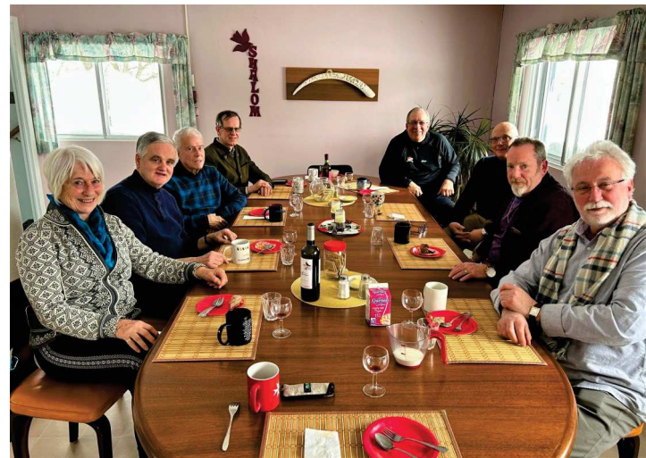
ORDRE DE MALTE JOURNÉE DE FORMATION - LE 18 FÉVRIER 2023