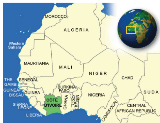
CÔTE D'IVOIRE Pays d'adoption de frère Michel