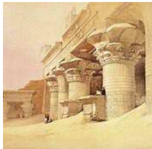
LITHOGRAVURES D'APRÈS LES DESSINS DE DAVID ROBERTS Saint-Sépulcre (Jérusalem) & Louksor (Égypte) Nazareth & Petra