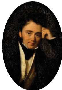
Pierre-Gustave Joly de Lotbinière