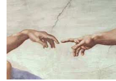
Tsèlèm - צֵלֶם Créés à l'ombre de D-ieu

Un des grands questionnements de la loi juive (et plus tard de l'Islam) trouve son origine dans la prescription absolue de représentation imagée du divin, ce qui semblerait exclure toute forme d'art. Le deuxième commandement stipule en effet: « Tu ne feras pour toi aucune image de quoi que ce soit dans le ciel ou sur la terre. » (Dt 5,7). Cette injonction pose un certain nombre de problèmes pour nous aujourd'hui car l'image est partout... Nous vivons dans la civilisation de l'image.