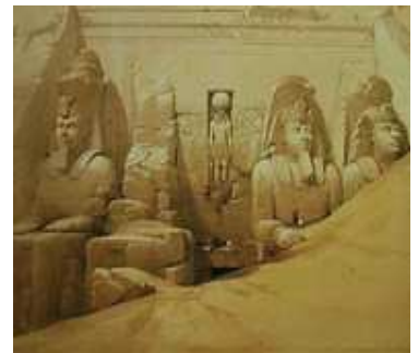
Abou Simbel (Égypte)