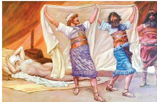
L'IVRESSE DE NOÉ