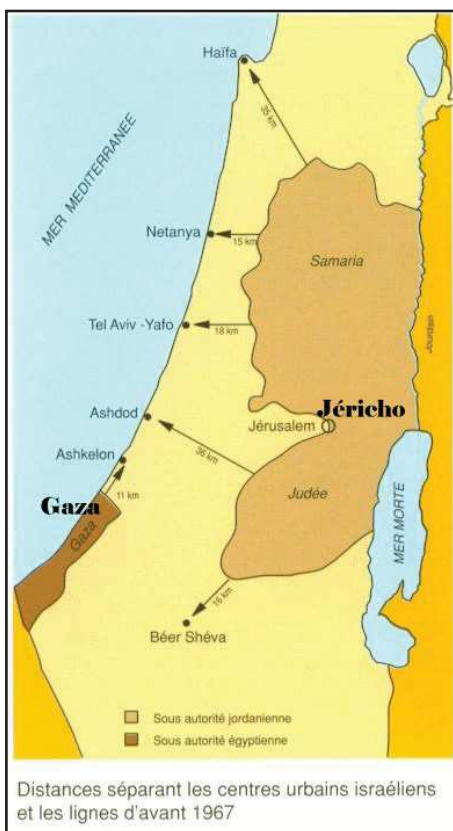
Distances séparant les centres urbains israéliens et les lignes d'avant 1967

« Je comprends que les Palestiniens veillent tuer nos enfants, mais je n'accepterai jamais qu'ils nous obligent à tuer les leurs. » (Golda Meir)