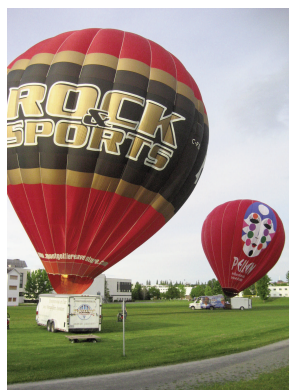
Départ de mongolfières Campus Notre-Dame-de-Foy