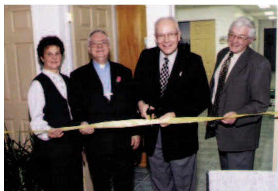
Inauguration du Centre Marianiste Le 22 octobre 2000