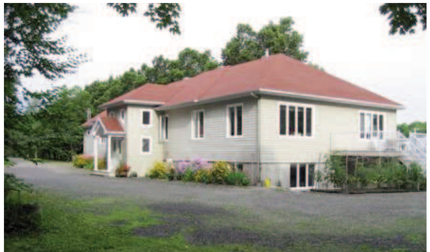
Centre Marianiste D'éducation de la foi Saint-Henri de Lévis