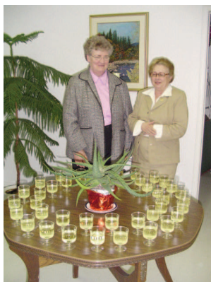
Le Centre Marianiste, c'est... un réseau de 700 personnes

Conseil d'administration Coeur du Centre Bénévoles Fraternité Groupe de prières Groupes de cheminement de foi Cellules d'évangélisation Session sur la guérison des souvenirs