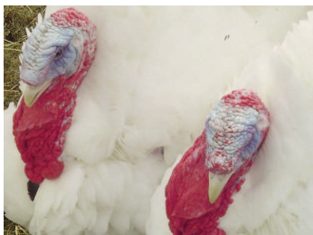
Élevage Dindes et moutons