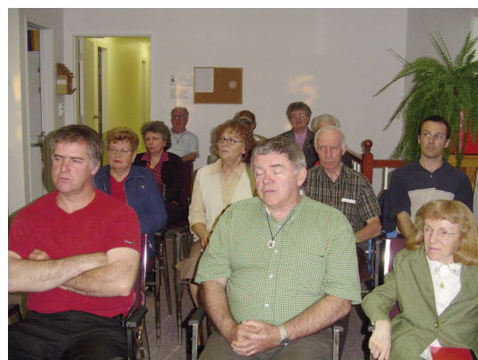
Chapelle du Centre Marianiste Laïcs de la Famille Marianiste