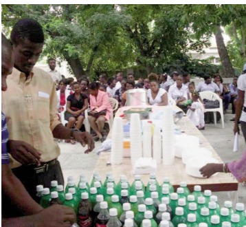
Haïti : Journée de prière SM Repas fraternel