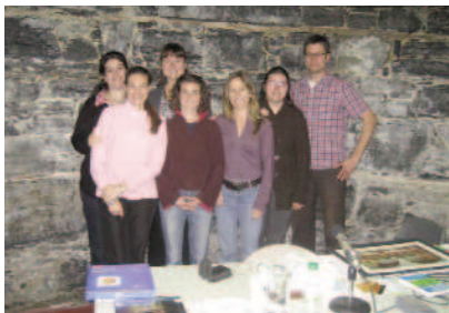
La Bande FM (Foi & Mission) Montréal - 15 octobre 2011