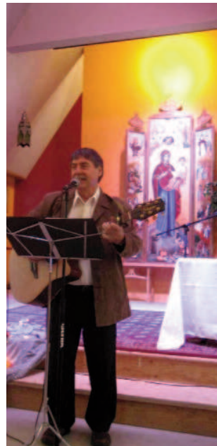
Nous portons un trésor Dans des vases d'argile Argile de nos corps Trésor d'Évangile

Ce caractère œcuménique englobe non seulement l'unité des chrétiens, mais aussi l'unité des croyants. « Versant-la-Noël » garde une place privilégiée à la jeunesse, un espace de réflexion et d'échange également pour toute personne désireuse de prendre conscience de son trésor intérieur et désireuse de porter ce trésor au monde d'aujourd'hui.