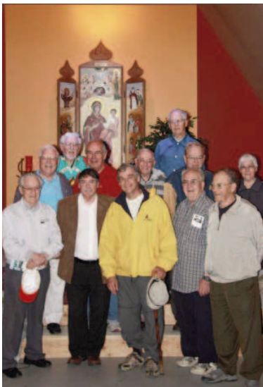
Visite à « Versant-la-Noël » le 10 octobre 2011