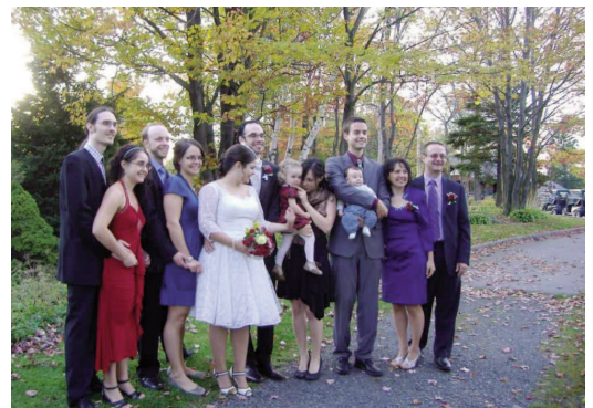
Famille Dion-Roberge 8 octobre 2011 - Mariage de Virginia