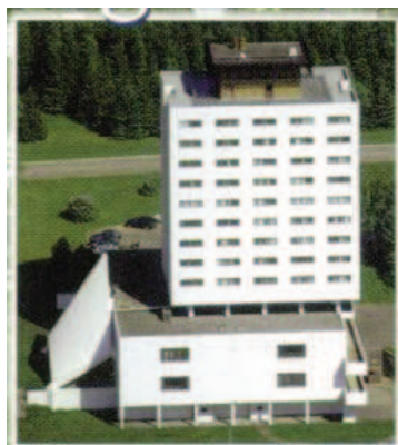
Résidence André-Coindre Prix « Pérennité » décerné par L'Ordre des Architectes du Québec