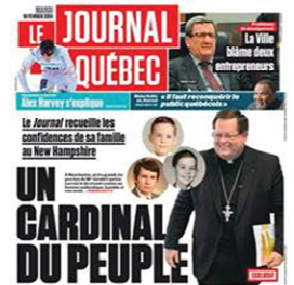
Mgr Gérard Lacroix Nouveau Cardinal du diocèse de Qué-