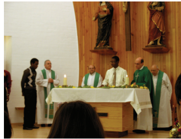
Scolastiques haïtiens en Espagne Renouvellement des vœux