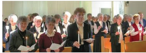
Journée de la Vie Consacrée Le 2 février 2014