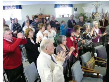
Journée des Fondateurs Centre Marianiste de Saint-Henri Le 19 janvier 2014