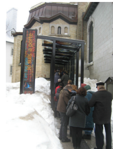
Porte Sainte - 12 janvier Ex-membres de FideArt