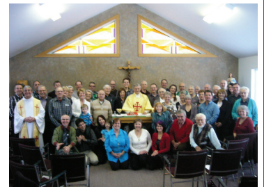
Journée des Fondateurs Centre Marianiste de Saint-Henri Le 19 janvier 2014