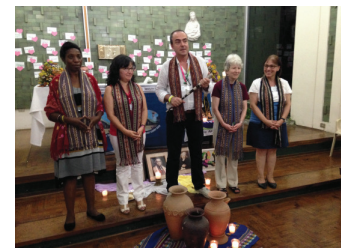
6 e Rencontre Internationale Lima (Pérou)