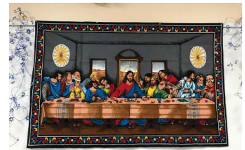
SEDER PASCAL - ST-NICOLAS