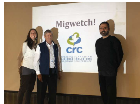
ASMDQ - DIOCÈSE DE QUÉBEC - 3 AVRIL 2017 Animation Le Jeu des territoires