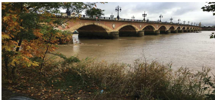
PONT DE PIERRE SUR LA GARONNE - CONSTRUIT SOUS NAPOLÉON