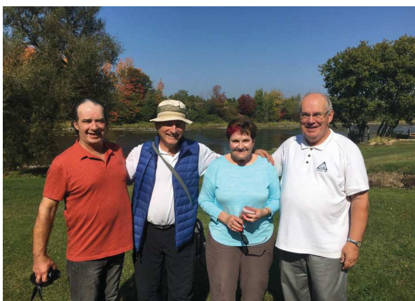
UNE VISITE « DORÉE » Saint-Henri—25 SEPTEMBRE 2017