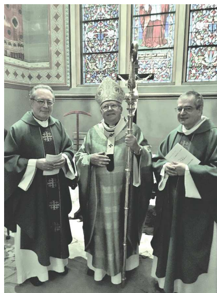
MESSE DU BICENTENAIRE CATHÉDRALE SAINT-ANDRÉ - BORDEAUX