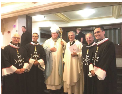
ORDRE DE MALTE - ADOUBEMENT - OTTAWA LE 9 SEPT 2017